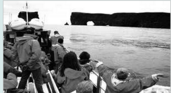
Ferðafólk siglir út að Dyrhólaey á hjólabáti. Myndin var tekin fyrir óhappið síðastliðið sumar.